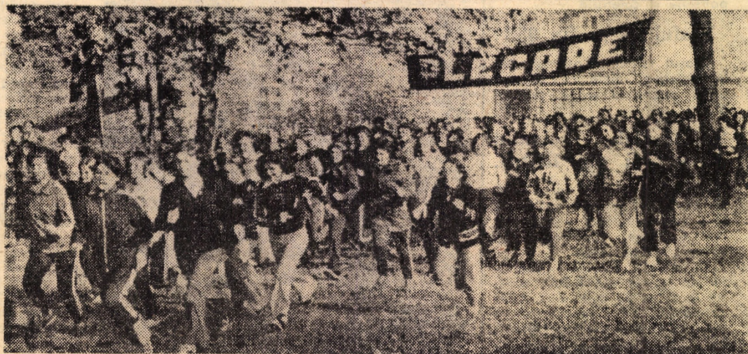
Start în proba elevilor din licee în „Crosul toamnei”