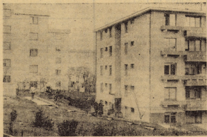
Cartierul „1 Mai” din orașul Agnita

Totodată, au fost difuzate o serie de lecții care expun pe larg principiile Legii electorale, esența democrației socialiste, superioritatea acesteia, politica partidului și statului nostru de ridicare a nivelului de trai al oamenilor muncii.