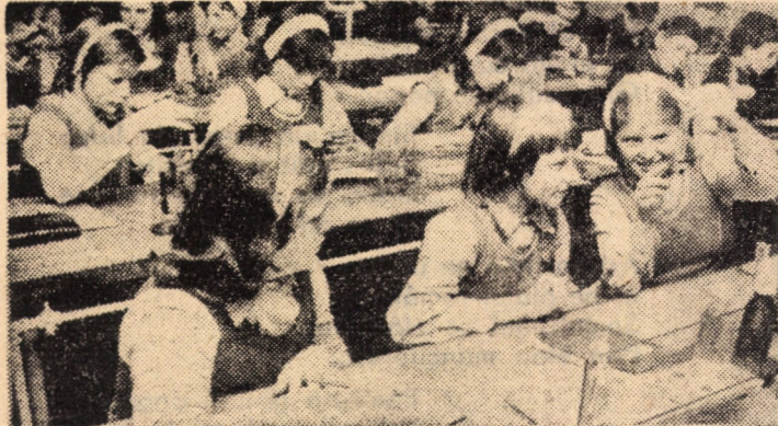
Elevii Școlii generale nr. 8 Sibiu beneficiază din acest an școlar de un laborator de chimie cu 40 locuri complet modernizat, apt desfășurării în condiții optime a experiențelor de laborator

metaforele, foarte abundente, să apară nejustificate (Ana Dumitru, Ioan Vinteler). Poezia Adrianei Stingă, în schimb, este bine construită, „rotundă”, metafora fiind susținută de un solid plan ideatic (Ana Dumitru). O excelentă poezie patriotică ne-a prezentat Ioan Gherman. Deși s-au remarcat influențe bliagene (Remus Halmaghi), transpunerea sentimentului patriotic este făcută în texte cu substanță, în metafore dense și bine integrate în structura poemelor. (D.T.S.).