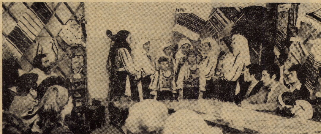
Noua reuniune a Salonului artistic „Studio” a prilejuit participanților, între altele, o emoționantă întîlnire cu grupul vocal al căminului cultural din Veștem.

Începînd cu 1 decembrie a.c., I.C.S.M.I. Mediaș deschide la clubul „Tineretului” o expoziție cu vânzare pentru desfacerea jucăriilor și a articolelor pentru copii. Expoziția funcționează