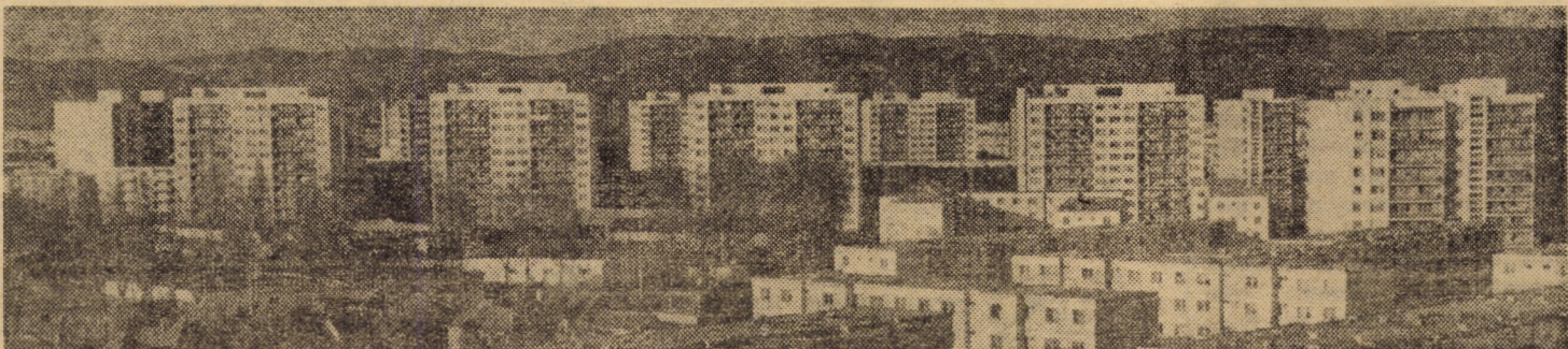
Evantaiul arhitectonic din cartierul sibian Hipodrom III

(Continuare în pag. a III-a) DUMITRU GEMENEL