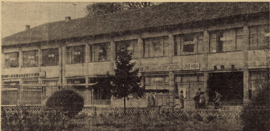
Complexul comercial din comuna Tîrnave

în curs reorganizarea fluxurilor tehnologice la produsele capete automate și brațe pentru A.M.C.-uri, semiautomate de 1, 5 și 10 kg, balanțele pentru bucătărie de 10 kg, cîntarele dinamometrice de 130 kg, pentru persoane, balanțele tehnice de 1 kg ș.a. De reținut că în urma reorganizării ergonomice a fluxurilor tehnologice menționate, se va obține o producție suplimentară valorînd două milioane lei.