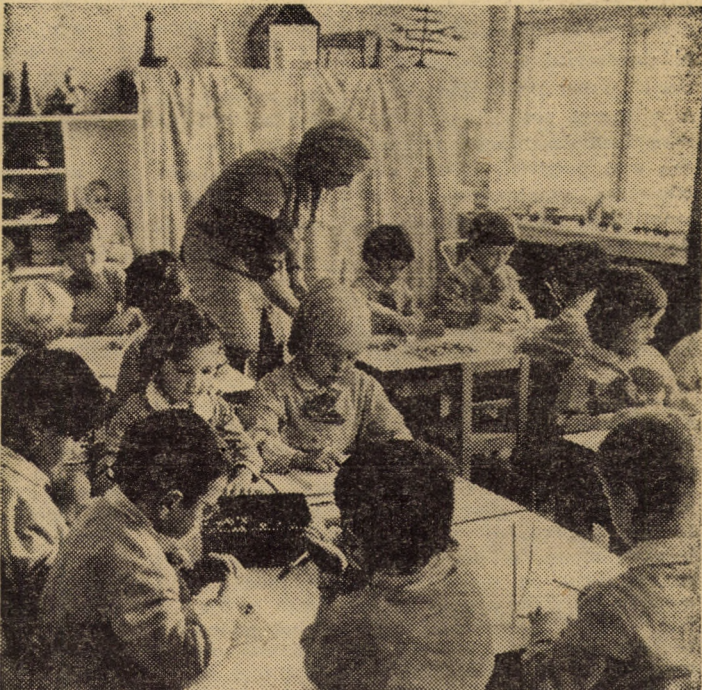
O nouă grădiniță cu program prelungit a fost deschisă recent în cartierul medieșean Gloria, dispunînd de 8 săli de grupă, totalizînd 240 locuri. În foto: grupa mare în timpul activităților alese: jocuri de construcții

Totodată, Austro-Ungaria n-a putut împiedica dezvoltarea industriei din vechea Românie. Statul român independent a luat o serie de măsuri de protejare și încurajare a industriei naționale, de aceea, ritmul ei de dezvoltare a crescut, în pofida tuturor greutăților.