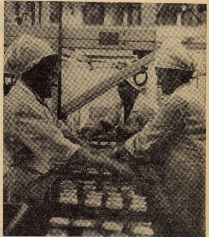
Întreprinderea pentru industrializarea laptelui Sibiu. Grație muncitorilor din secția îmbuteliat și expediție, laptele pentru consum ajunge punctual — la prima oră a zilei — la punctele de desfacere și în magazinele specializate

Oamenii muncii din sectorul zootehnic al agriculturii cooperatiste, cadrele de conducere trebuie să se considere din acest moment mobilizați exemplar în acțiunea de îmbunătățire substanțială a activității acestui important și tradițional sector de activitate economică, cu consecințe și implicații directe asupra creșterii nivelului de viață al tuturor oamenilor muncii.