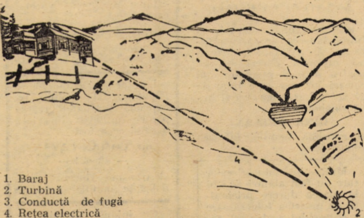
1. Baraj 2. Turbină 3. Conductă de fugă 4. Rețea electrică

Cu eforturi și investiții minime se poate realiza un hidrogenerator capabil să furnizeze energie electrică unor mici așezări montane. Schița de mai jos este concludentă, principala ei virtute rămânând, după părerea noastră, simplitatea; o simplitate care o face întru totul realizabilă, oricând și oriunde în zona de munte.