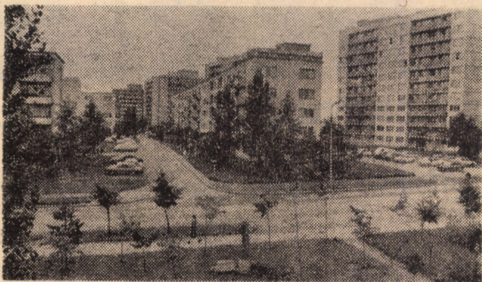
Citadină sibiană '79