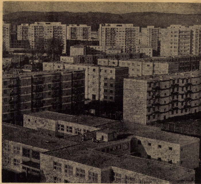
Panoramic al cartierului Hipodrom — Sibiu