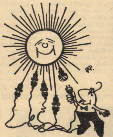
Desen de ADRIAN POPESCU