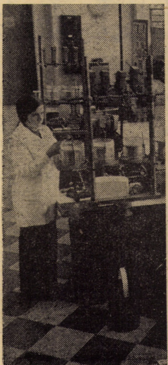
Aspect dintr-un atelier al întreprinderii de relee Mediaș