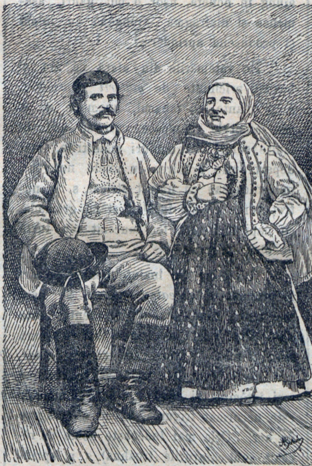
Români din Zarand.

Să sperăm, că această scriere va ave darul să îndemne pe mulți dintre noi a visita în mod sistematic mândra Transilvanie .