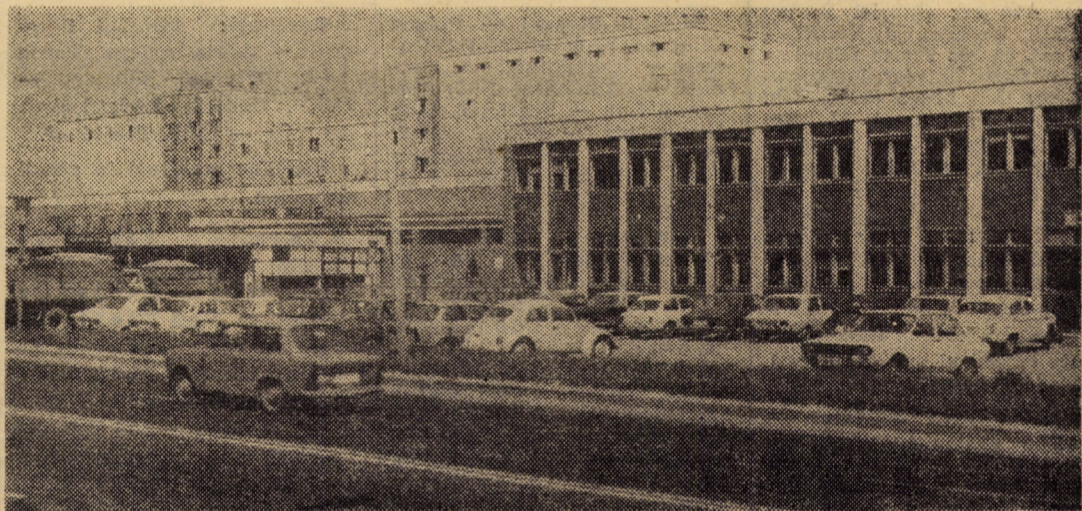
Platforma industrială Sibiu-vest: Întreprinderea de morărit și panificație

Concomitent s-a lucrat intens și la recoltatul cartofilor. După situația din dimineața zilei de ieri lucrarea a intrat în cote finale. Mai sînt cartofi de recoltat (suprafețe mai importante) la Ocna Sibiului, Arpașu de Jos și Avrig. S-a continuat recoltatul și la sfecla de zahăr. Cu ce s-a lucrat duminică (66 hectare) cultura a fost recoltată de pe 51 la sută din suprafețe. Sînt încă mari cantități de sfeclă de zahăr și colete pe cîmp în unitățile cooperatiste de pe valea Hirtibaciului (Marpod, Roșia, etc.).