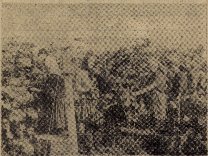
La cules de struguri în ferma Dobirca

Pentru amatorii de asemenea fapte necinstite o informație descurajantă: organele de miliție vor intensifica măsurile de pază și control pe tot cuprinsul județului (decî, și la Riura) în vederea curmării tuturor fenomenelor de furt de produse agroalimentare din averea obstii. (S. Ion)