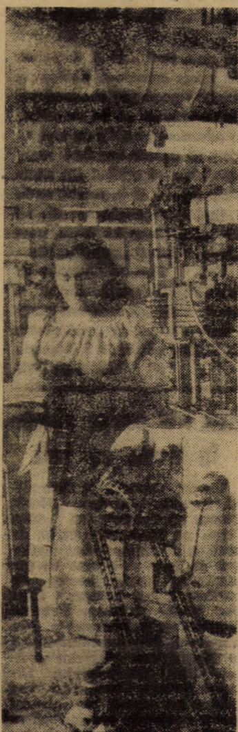
Întreprinderea „7 Noiembrie” Sibiu. În secțiile de tricotat se acordă în permanentă o atenție deosebită calității produselor, concretizată prin efectuarea controlului interfașic