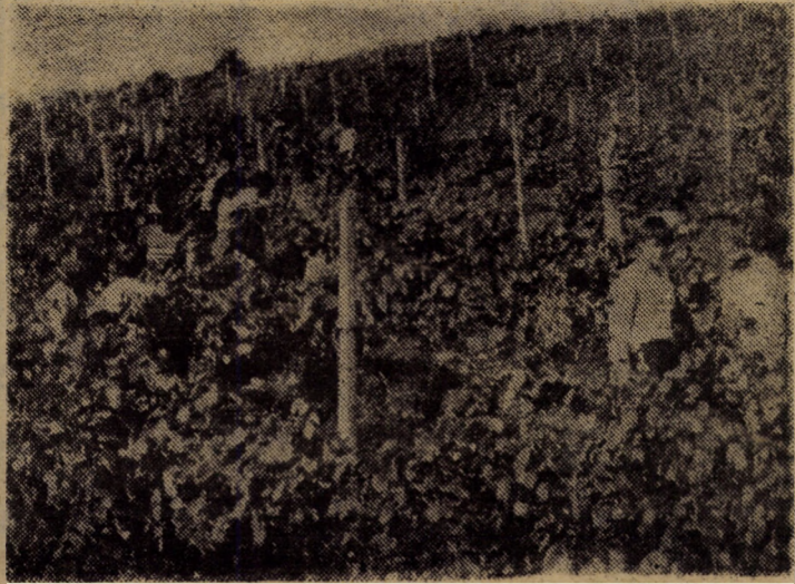
Elevii școlii generale din Miercurea Sibiului au împinșit dealul la cules de vie

În această perioadă se desfășoară alegerile pionieresti. Sub genericul „Alegerile pionieresti — expresie a democrației socialiste” au loc adunările-model de alegeri la nivelul detașamentelor claselor a IV-a — a VIII-a de la școlile generale nr. 4, 5 și 7 din Medias (12—13 oct.), la școlile generale nr. 1, 2 și 3 din Agnita (14—15 oct.) — clasele a IV-a, a V-a și a VIII-a. • Și tot la școlile generale din Agnita, în această săptămînă, au loc primiri în organizația de pionieri sub genericul „Ieri șoimi, azi pionieri”. • „Harnic, ca harnicul nostru popor” este genericul unei ample acțiuni de colectare a ambalajelor din sticlă, la care participă toți pionierii din Ocna Sibiului. • Acțiuni de muncă patriotică sub genericul „Aportul nostru la economia țării” desfășoară și pionierii de la Școala generală nr. 5 Medias, în vederea realizării integrale a angajamentului economic. • Centenarul nasterii poetului George Bacovia prilejuește o serie de acțiuni în școli. Astfel, la Școala generală nr. 2 din Medias este deschisă o expoziție de carte, iar vineri, 16 octombrie, membrii cîntărilor literare de la Școala generală nr. 7 din Sibiu vor prezenta un medalion dedicat creației poetului. (A. Chișu).