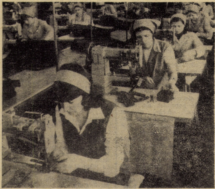
Formație de lucru la bandă în atelierul confecționat valize al întreprinderii „13 Decembrie” Sibiu — atelier în care media de vîrstă a muncitorilor nu depășește 25 ani. Pentru bunele rezultate în realizarea sarcinilor pentru export, acest colectiv se numără în permanență printre cele fruntașe în cadrul întreprinderii