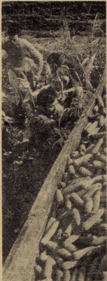
Pretutindeni pe ogoarele județului se muncește intens la stringerea și depozitarea porumbului

Miine, în jurul orei 16,00, posturile de radio și televiziune vor transmite direct ceremonia sosirii președintelui Republicii Federației Germaniei, Karl Carstens, și a doamnei Veronica Carstens, care, la invitația tovarășului Nicolae Ceaușescu, președintele Republicii Socialiste România și a tovarășei Elena Ceaușescu, vor efectua o vizită oficială în țara noastră.