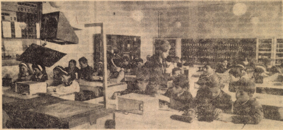
În orele de fizică, elevii școlii generale nr. 18, Sibiu, manifestă un interes deosebit pentru experiențele efectuate în condiții excelente în cadrul laboratorului de fizică-chimie al școlii