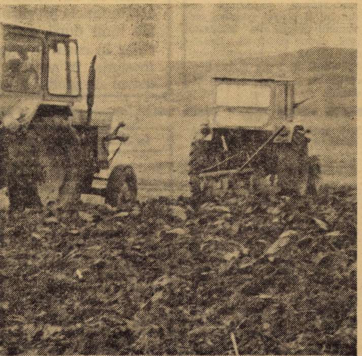
Arături adinci de toamnă pe terenurile C.A.P. Nocrich

Recolta este bună. Ne-am convins ca urmare a faptului că doar după o trecere prin lan, buncărul combinei s-a umplut pînă la refuz. De ieri, 19 octombrie urma să mai intre în lan încă două combine astfel încît pînă în 25 octombrie întreaga suprafață de porumb rămasă, să poată fi recoltată. Tot porumbul recoltat a fost livrat Asociației economice intercooperatiste Șura Mică, principalul beneficiar, în curtea căreia a fost amenajată și o bază de treierat staționar, pentru cel recoltat manual.