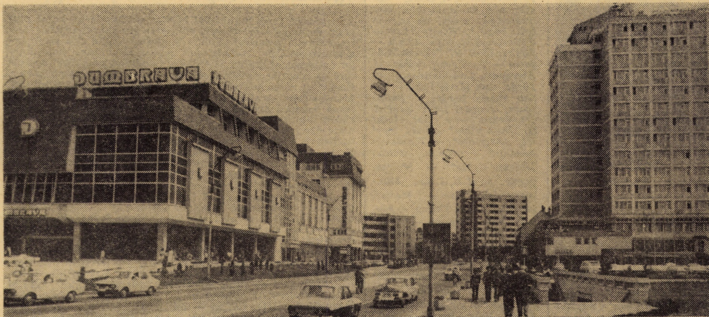
La ceas de adincă semnificație pentru destinele întregii țări, municipiul Sibiu, asemenea tuturor așezărilor județului și țării, oferă imaginea unui oraș modern și prosper, a cărui zestre edilitar-gospodărească se îmbogățește zilnic cu mai falnice edificii, cu noi dotări. Piața Unirii — din imagine — reprezintă una dintre cele mai noi și mai reprezentative zone urbane ale Sibiului zilelor noastre.