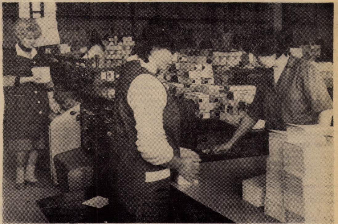
Calitate superioară și eficiență economică sporită - este deviza personalului muncitor din secția legătorie a întreprinderii poligrafice Sibiu, cu care cinstește marele forum al comunistilor

Lucrările Conferinței Naționale a partidului continuă.