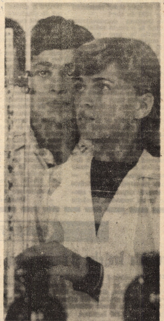
Succesul la învățătură al elevilor clasei a XI-a A de la Liceul de chimie industrială „Carbosin” Copșa Mică se concretizează printr-un procent de promovabilitate de sută la sută.

Iată cîteva notații despre jocurile disputate în serii: ● Cel mai sever scor s-a înregistrat în jocul dintre Oficiul de calcul Gaz metan și selecționata „Tirnavă” — „8 Mai”, 19-0 în favoarea primei echipe ● Echipa cea mai disciplinată a fost declarată cea a Oficiului de calcul Gaz metan ● Jucătorul cel mai eficient — tînarul informatician matematician Ion Munteanu, de la Oficiul de calcul Gaz metan cu 10 goluri înscrise! Mihai ȚACAL