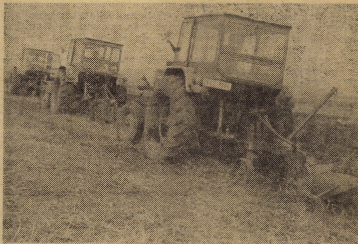
După eliberarea terenurilor la C.A.P. Șura Mică, se acționează imediat pentru executarea arăturilor adînci de toamnă.

O imagine tonifiantă, pe care am dori s-o întîlnim peste tot în drumurile noastre.