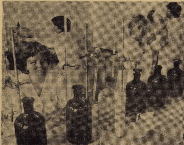
Din luna august a.c., la Fabrica de geamuri Mediaș a intrat în funcțiune un nou laborator de analize chimice, dotat cu întreaga aparatură necesară pentru analiza materiilor prime și produselor finite. Tot aici urmează să fie amenajat în curînd și laboratorul pentru determinări fizice a caracteristicilor geamurilor destinate echipării autovehiculelor.

Iată deci cîteva aspecte concludente care dimensionează credem opțiunea locuitorilor comunei Miercurea Sibiului pentru progres și bunăstare.