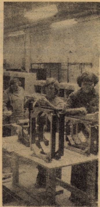
Fabrica de mobilă Medias: asamblarea corpurilor de mobilier la produsele destinate exportului

Orlat au reușit ca pînă la această oră să încheie contractele planificate pentru anul viitor la majoritatea pozitiiilor stabilite. Astfel la porcine se înregistrează față de plan o depășire de 6 capete, la ovine adulte 13 capete, miei 5 capete, lapte de oaie 3 hectolitri, iar la bovine adulte și lînă de oaie au fost încheiate contracte pentru 12 tone carne, respectiv 3 975 kg lînă. Aceste realizări închinăte evenimentului aniversar de la 30 Decembrie, certifică desigur că nu întîmplător comuna Orlat este cotată ca una dintre așezările de frunte ale județului nostru. (N. I.).