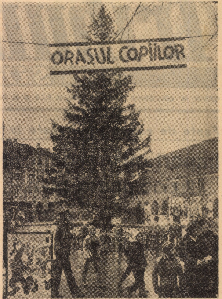
Spre bucuria celor mici, în Piața 6 Martie din Sibiu s-a deschis orașul copiilor