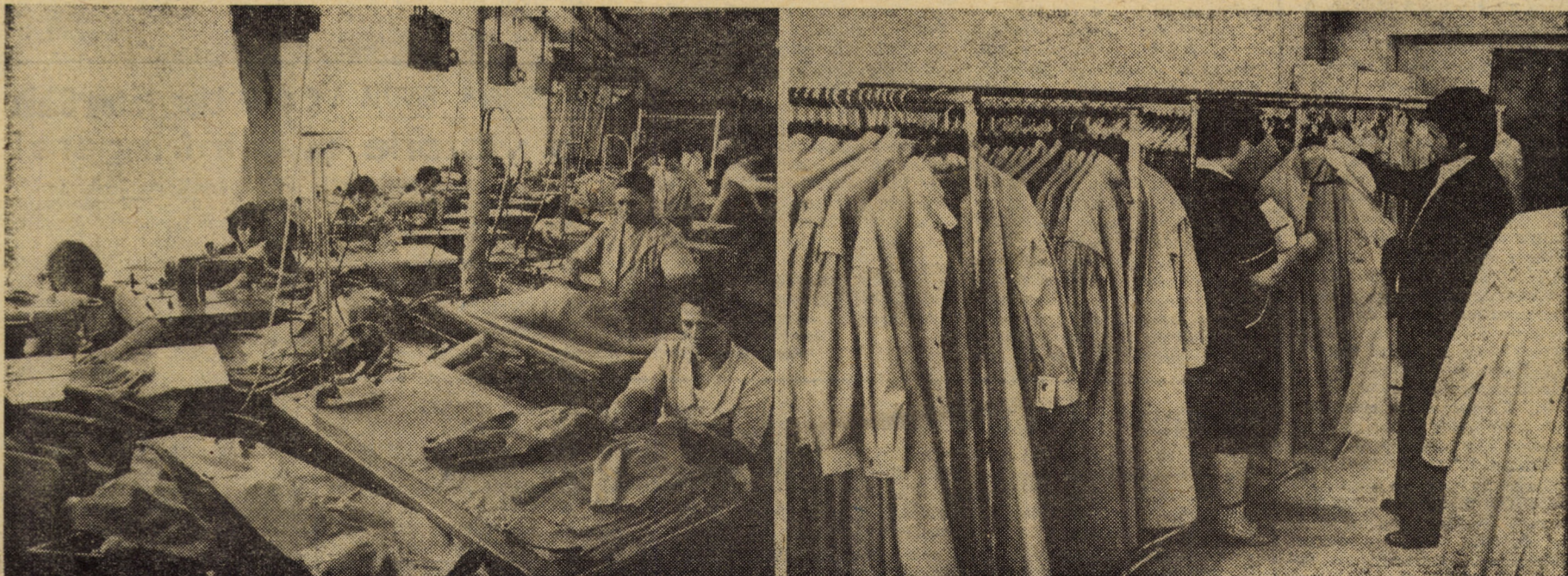
La imagine: una dintre liniile tehnologice model pentru confecționarea impermeabilelor