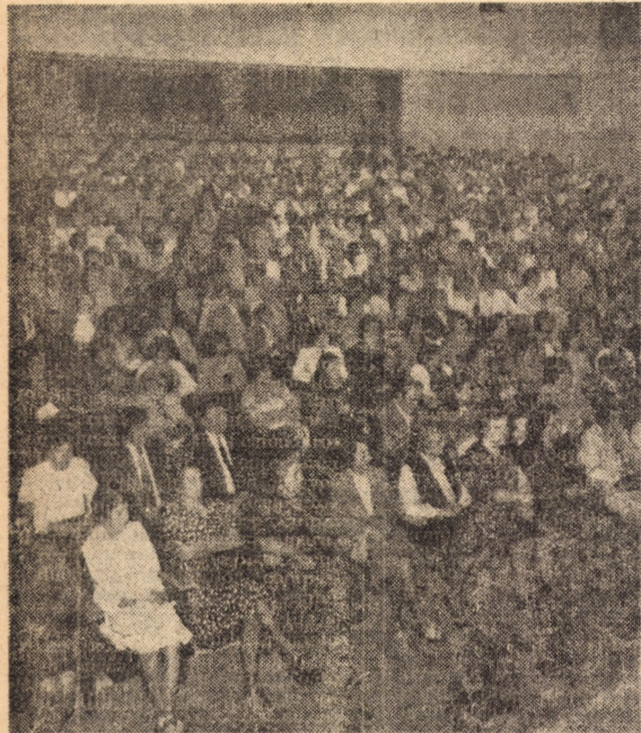
Imagine din timpul desfășurării adunării festive consacrată „Zilei învățătorului”.

Adunări festive prilejuite de „Ziua învățătorului” au mai avut loc la Medias, Agnita, Cisnădie, Dumbrăveni, Ona Sibului, Coșa Mică, Săliște, Miercurea Sibului, Avrig, Tâlmăciu, Neerich și Roșia.