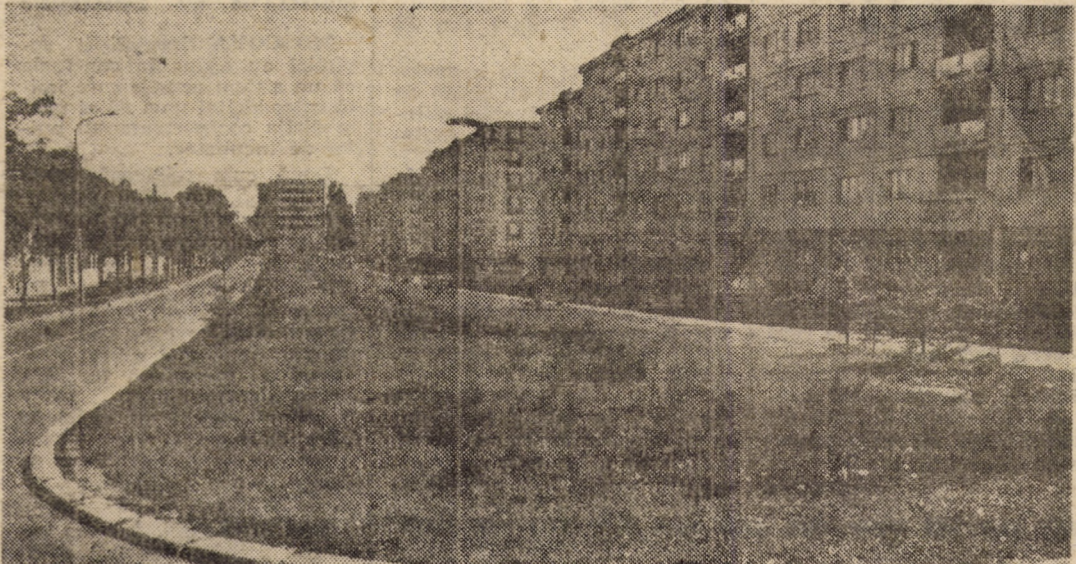
Str. Școala de inot din Sibiu se numără azi — prin frumoasele construcții amplasate aici — printre arterele modernizate ale municipiului reședință de județ.