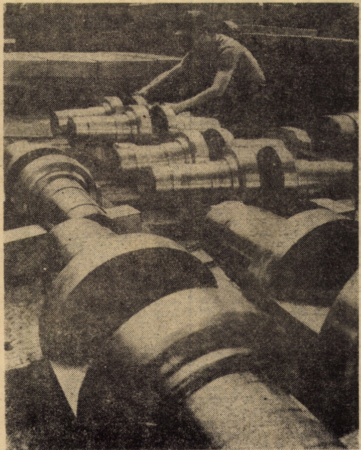
Întreprinderea „Independența” Sibiu se numără azi printre unitățile de bază în ramura industriei constructoare de mașini grele ale municipiului, cîștigînd — în fața beneficiarilor interni și externi — un binemeritat prestigiu. În fotografie: control interfazic la un lot de valțuri pentru caje de laminare, destinate exportului

A avut loc, de asemenea, un schimb de păreri cu privire la evoluția situației internaționale.