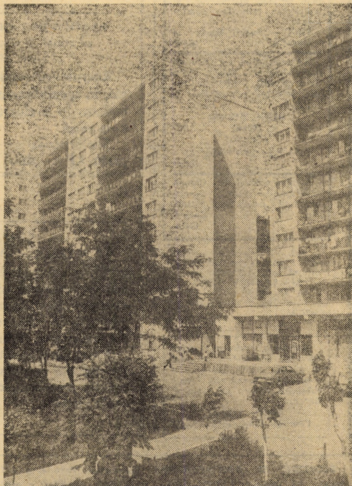
Construcții moderne de locuințe în municipiul Mediaș