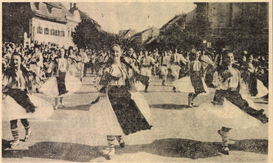
Ansambllul folcloric „Doina Transilvaniei” al Clubului întreprinderii „Independența” din Sibiu a fost distins cu premiul special al Comitetului județean de cultură și educație socialistă la recenta ediție a Concursului folcloric interjudețean „Cîntecele munților”