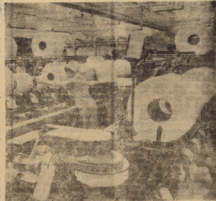
Secvență de lucru din secția filatură a întreprinderii „Furul roșu” Tâlmaci

unele produse tradiționale de la „Tehnică nouă” Sibiu, care completează cu succes oferta pentru 1987: obiecte din sticlă gravată, sifoane de 1 și 2 l, lămpi ornamentale cu lichid, lămpi cu gaz, articole pescărești și alte obiecte de uz casnic și gospodăresc. Se întrevide ca în scurt timp să fie oferite fondului pieții și alte noutăți: lanseta de pescuit tubulară, legături de schiuri pentru copii, primus pentru voiaj ș.a. Toate acestea confirmă multiplele posibilități ale cooperatiei meșteșugărești în valorificarea materialelor locale și a celor re-folosibile din industrie.