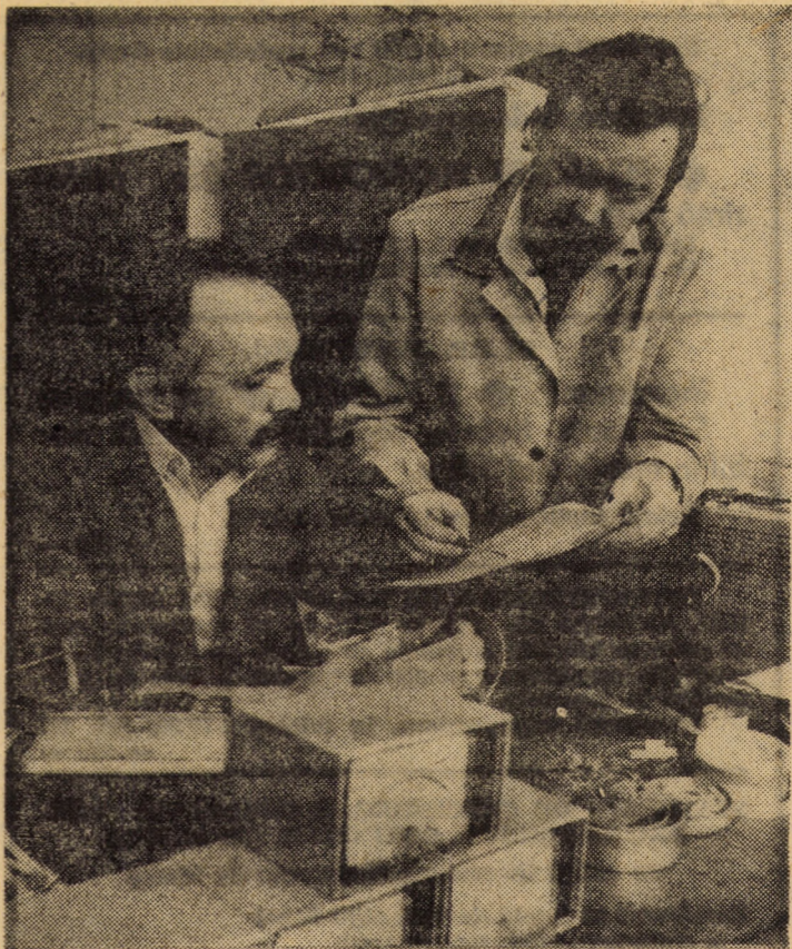
Atelierul de electronică al I.M.A. Sibiu dispune în prezent de cadre cu o bună pregătire profesională. Printre realizările recente ale colectivului se înscrie și termosonda electronică, folosită la măsurarea temperaturii cerealelor depozitate în magazii

În al doilea rînd, nici responsabilii magazinelor forestiere nu s-au implicat suficient în asigurarea unei bune aprovizionări, chiar la produsele unde livrările s-au situat la nivelul cerințelor. Cea mai bună dovadă că, printr-o preocupare responsabilă, probleme aparent nerezolvabile își găsesc soluția, o reprezintă exemplul magazinelor frunțașe. Exemplu care se cere grabnic generalizat.