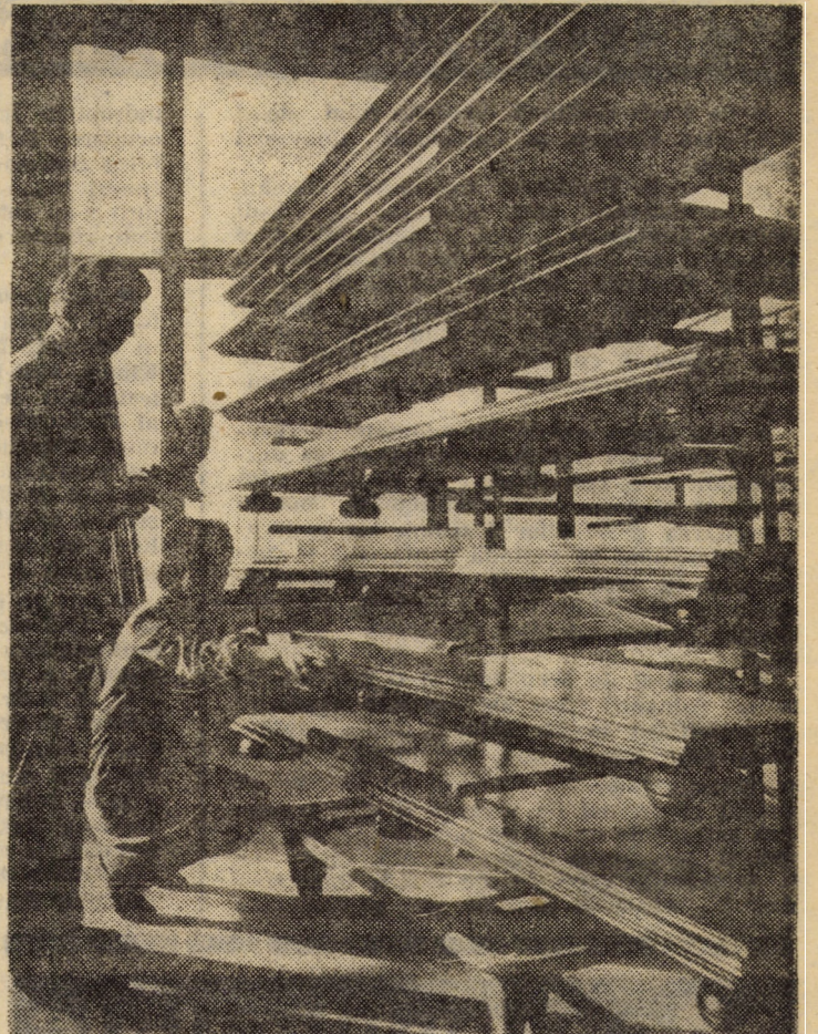
Un ultim retuș la un lot de componente pentru produsele destinate exportului, efectuat în secția finisaj a sectorului II mobilă al I.P.L. Sibiu

Toate aceste fapte de muncă sînt o dovadă grăitoare a hotărîrii oamenilor muncii din județul nostru de a întîmpina Conferința Națională a partidului cu un bilanț cît mai rodnic de realizări.