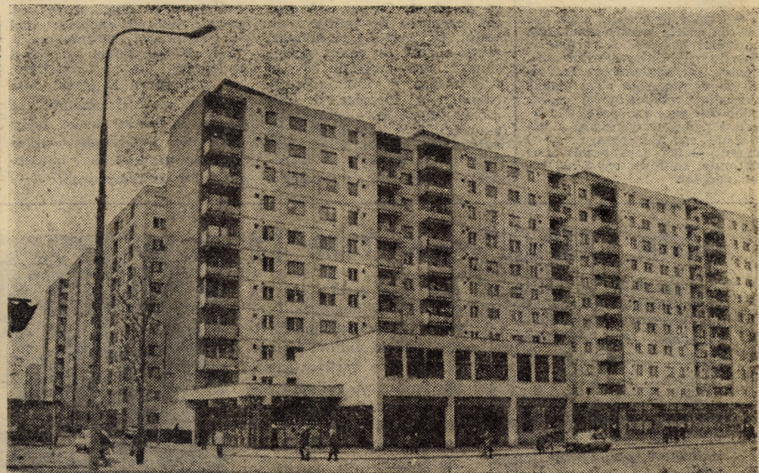
Ca și alte cartiere de locuințe ale municipiului Sibiu, și cel din „Vasile Aaron” beneficiază de numeroase construcții la parterul cărora funcționează unități comerciale moderne și de prestări servicii ale cooperației, cum sînt cele de pe str. Semaforului