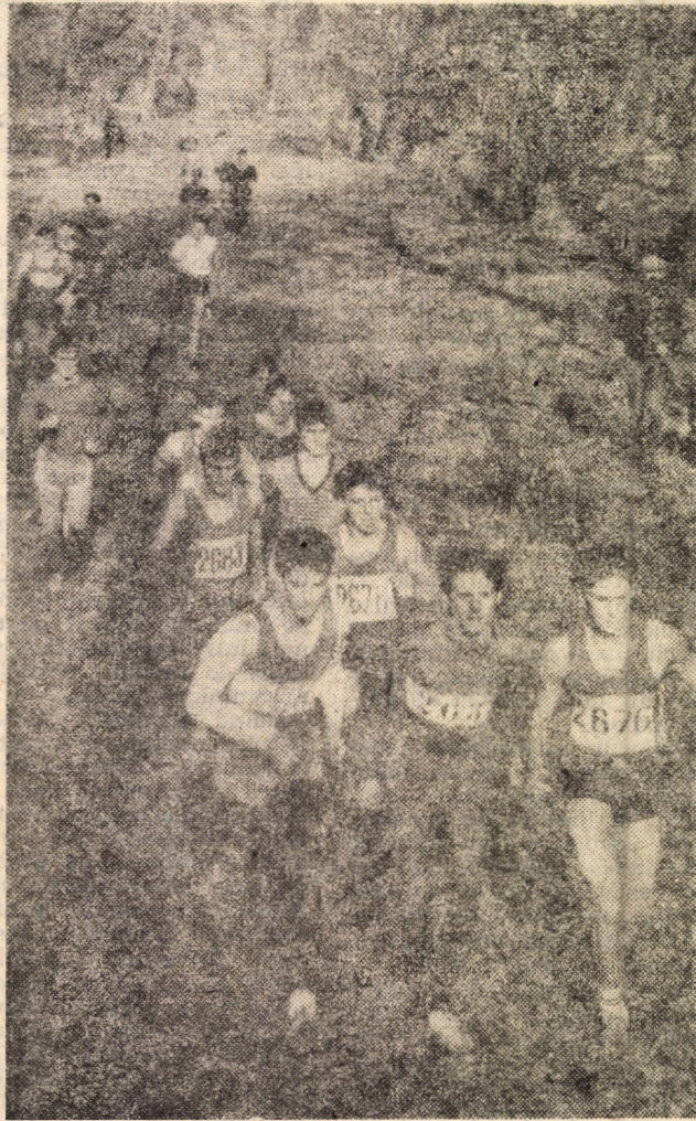
Aspect din cursa juniorilor cat. I a etapei județene de cros

Aleile parcului „Sub arini” din Sibiu au găzduit, în organizarea C.J.E.F.S. Sibiu, prin comisia de atletism, etapa județeană a Campionatului național de cros,