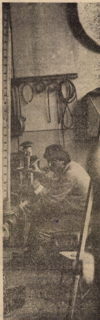
Întreprinderea Mecanică pentru Gaz Metan Mediaș — una din unitățile economice fruntașe din județul nostru. Imaginea de față este surprinsă la unul din standurile de probă pentru aparatură pneumatică