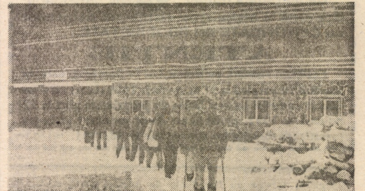
Cabana Negolu — una din bazele de plecare ale celor care vor să cucerească crestele munților Făgărașului — a devenit locul de „botez” al clubului studențesc de ecologie și turism „ECOTUR”