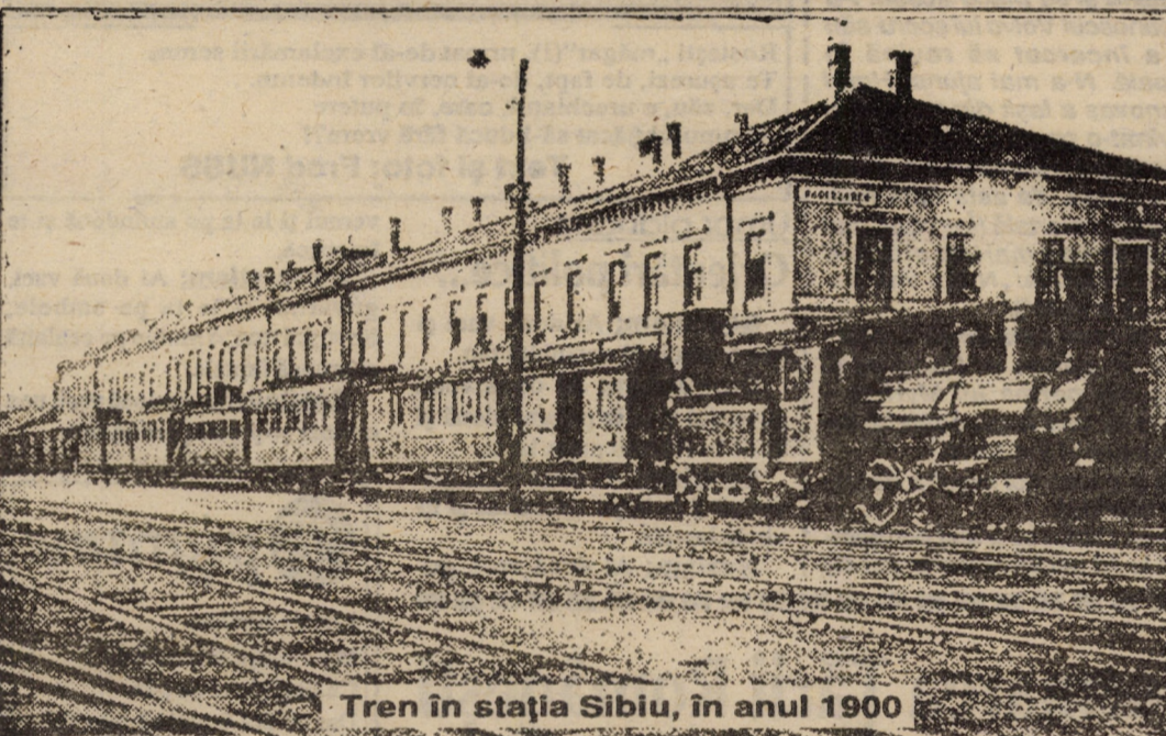
Tren în stația Sibiu, în anul 1900

de ani”, se arată în articol, criticând, în continuare, guvernul ungar, „care a concesionat calea ferată Homorod - Făgăraș fișpanului M. Horvath senior, iar calea ferată Făgăraș - Sibiu a fost încredințată unui tînăr fără nici o importanță, afară doar că este fiul fișpanului și funcționar de mîna a doua la Comitatul Tîrnavei Mari”. Dacă statul ungar dorește această linie la Homorod, strategică sau din alte considerații, să nu o facă pe spinarea contribuabililor, pentru ca d-l. fișpan să facă un recensămînt și să vadă cîte mii de suflete și-au luat lumea în cap și au părăsit pămîntul natal, care nu mai are mai nimic aici; fabrici nu sînt, căci cele de sticlă și-au oprit activitatea, iar agricultura nu acoperă nici cererile locale ale celor trei fabrici de spirit, care cumpără cucuruzul din România.”