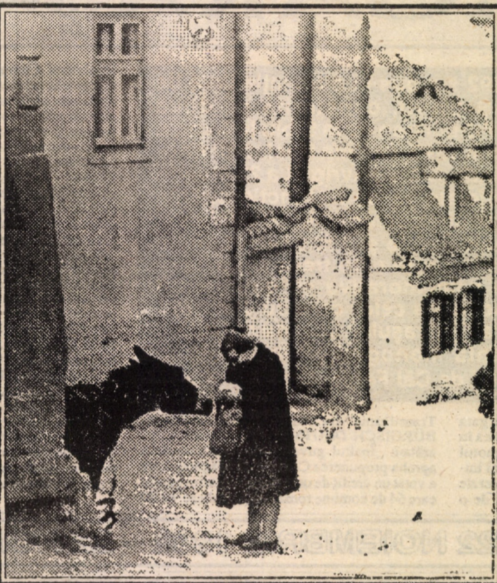
Rostești „măgar”(!), urmat de-al exclamării semn. Te ușurezi, de fapt, de-al nervilor îndemna. Dar, zău, e urechiatul, care, în putere Al omului păcat să-l ducă fără vrere?! Text și foto: Fred NUSS