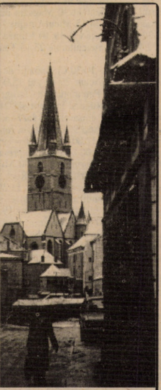
Strada Centumvirilor - un loc preferat de fotoreporteri

au făcut impresie deosebită. Vizita a fost urmată de discuții cu muzeograful sibienu, antrenate în mod deosebit în urma vizionării unor casete cu aspecte reprezentative pentru civilizația populară tradițională ucraineană și românească. Profilul tematic, structura și componența de patrimoniu, rolul de ambasado