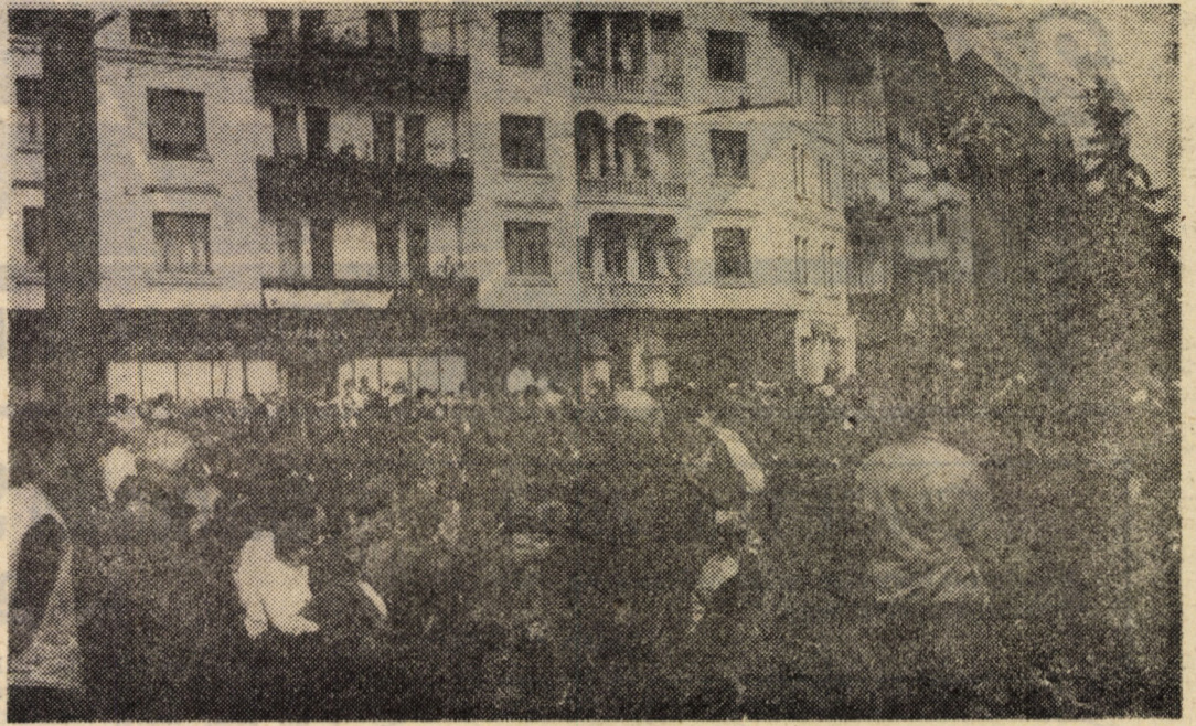
Remember Timișoara: 100 de zile de la declanșarea Revoluției. Eroii sînt în genunchi și în pămînt, iar ceilalți în picioare, dau onorul. Așa a început libertatea noastră.

Cînd vom mai anunța asemenea activități, precizăm că pot participa la ele toți iubitorii de literatură din municipiu. La întîlnirea care a avut loc, n-am văzut nici un asemenea „iubitor”. Totuși, invitația rămîne pentru toate viitoarele întîlniri. Dr. G. N.