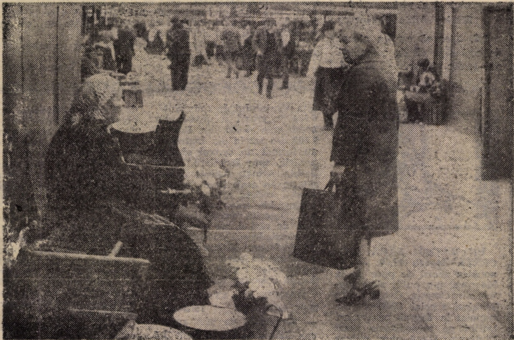
Să nu uităm nicicînd... florile bătrinelor săsoaice